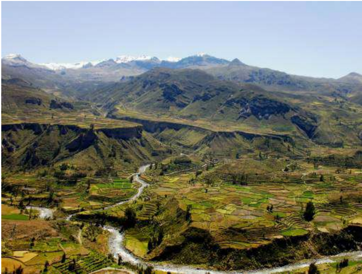
Fig. 3. Andenes en el valle del Colca, que fueron construidos por la cultura Wari e Incas entre los siglos VII y XV. Este importante patrimonio cultural viene siendo deteriorado por derrumbes, deslizamientos y caídas de roca. Según AUTOCOLCA más del 50% se hallan en mal estado.

daños en los poblados localizados alrededor del volcán, causando la muerte de algunas personas y ganado a consecuencia de epidemias desconocidas y contaminando terrenos de cultivo. En ocasiones, las cenizas se mezclaron con el agua de lluvia y se transformaron en flujos de barro, que durante su recorrido destruyeron áreas de cultivo localizados en el valle de Ubinas.