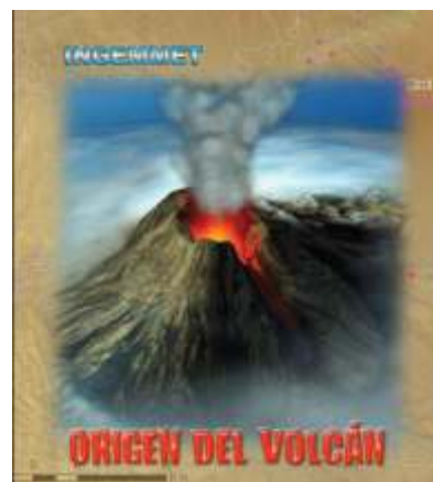
Fig. 2. Materiales de difusión elaborados para la educación de la población frente a los peligros volcánicos

Por ello, la Dirección de Geología Ambiental y Riesgo del INGEMMET, viene realizando desde hace 3 años, trabajos de evaluación de peligros geológicos en el Valle del Colca, principalmente en el tramo entre los poblados de Pinchollo y Chivay, entre los que figuran: