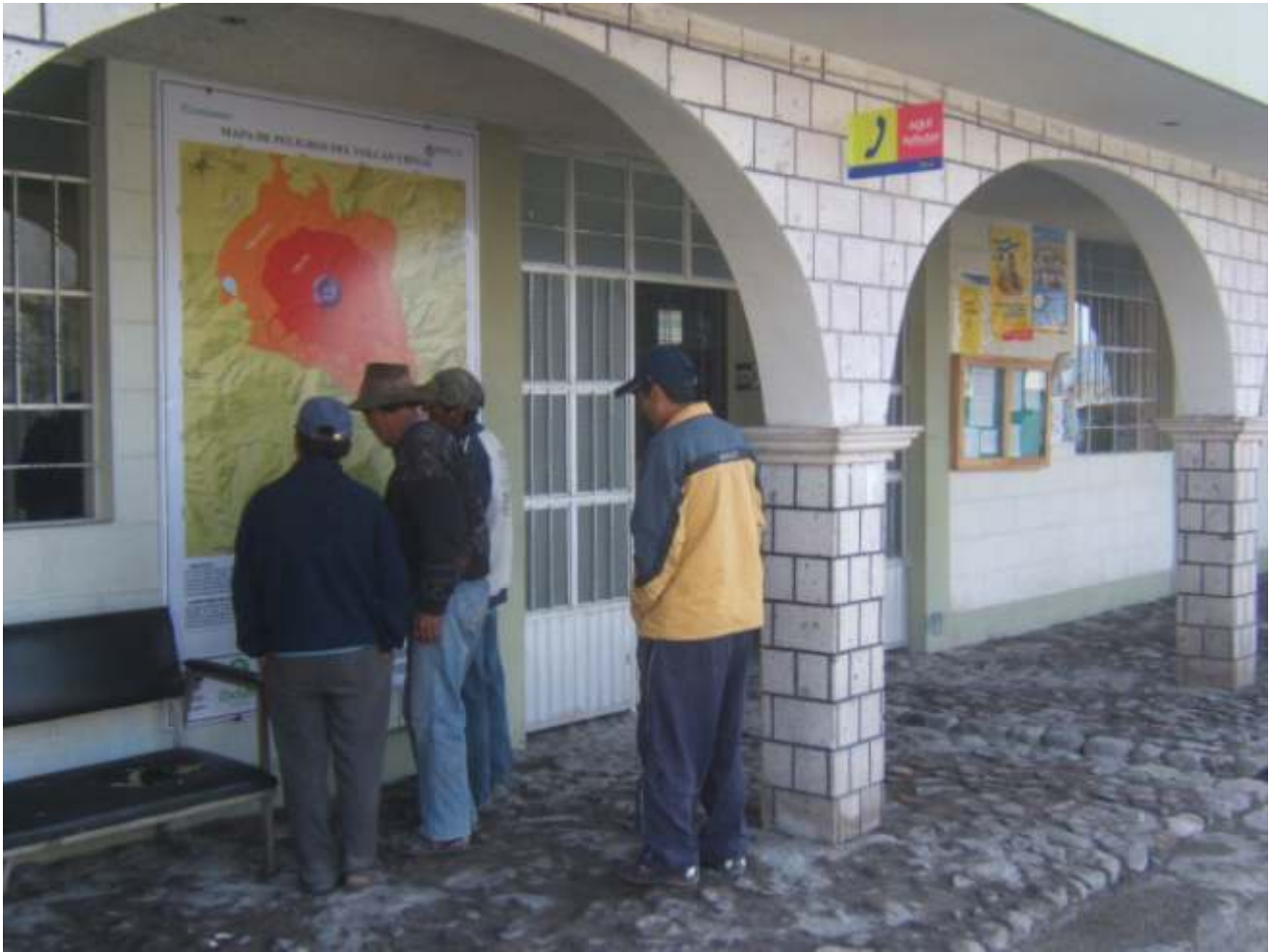
Fig. 6. Difusión del mapa de peligros del volcán Ubinas.