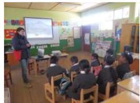
Fig. 4 y 5. Charlas en diferentes instituciones educativas de los poblados aledaños a los volcanes Tutupaca y Yucamani en la Región Tacna.

Gracias a los trabajos realizados, las autoridades y población en conjunto van tomando conciencia del entorno en que viven, con esto se logra que poco a poco se mitiguen los desastres y por consiguiente garantizar una mejor calidad de vida para los peruanos.