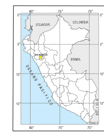
UBICACION DEL AREA DE ESTUDIO

DECLINACION MAGNETICA APROXIMADA EN 1970 PARA TODO EL CUADRANGULO VARIA ANUALMENTE 6.51 OESTE