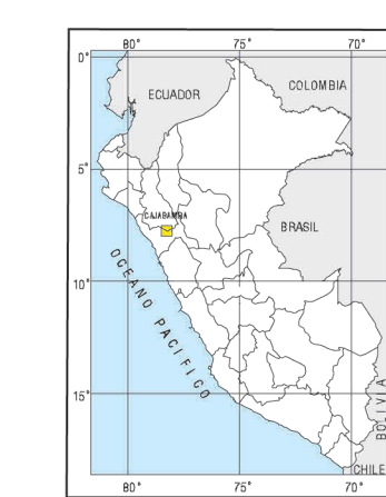
UBICACION DEL AREA DE ESTUDIO