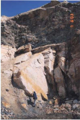
Foto N° 1 Areniscas cuarzosas y lutitas negras del Grupo Ambo noreste de la laguna Venenocoha (8 824 000 - 360 000).