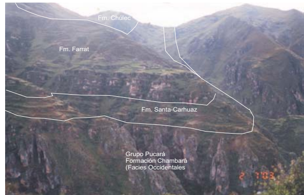
Foto N° 2 Contacto entre el Grupo Pucará y el Grupo Goyllarisquizga (Formaciones Santa-Carhuaz y Farrat). Margen izquierda del río Auquiragra (8 836 000N - 341 000E). Vista tomada al Noroeste, desde la márgen derecha del río antes mencionado.