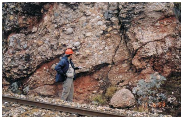
Foto N° 5 Conglomerados con clastos de calizas y arenosa, con intercalaciones de areniscas rojas, pertenecen al Mienbro Shuco de la Formación Pacobamba. En la línea férrea Colquijirca-Cerro de Pasco (8814 406N - 359 831E).