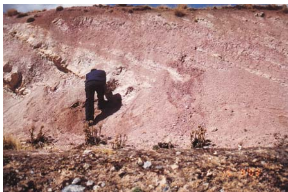
Foto N° 6 Secuencia de lutitas rojas masivas con calizas lacustrinas pardo claras pertenecientes a la Formación Calera, noreste de Yanamate (8816 644N - 362 388E).