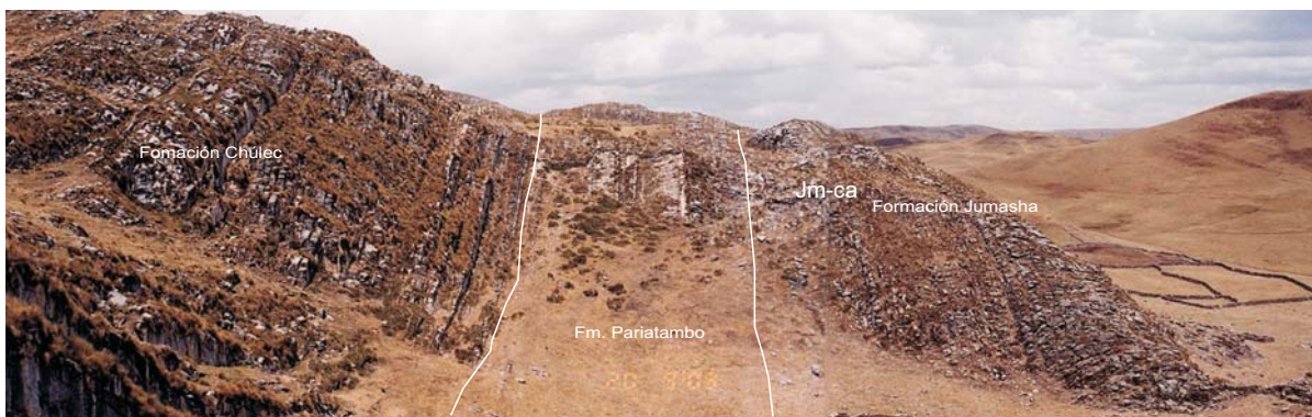
Foto N° 4 Formaciones calcáreas del Cretáceo inferior a superior. Margen izquierda en el cerro Cuipan (8 830 000 N - 336 000 E)