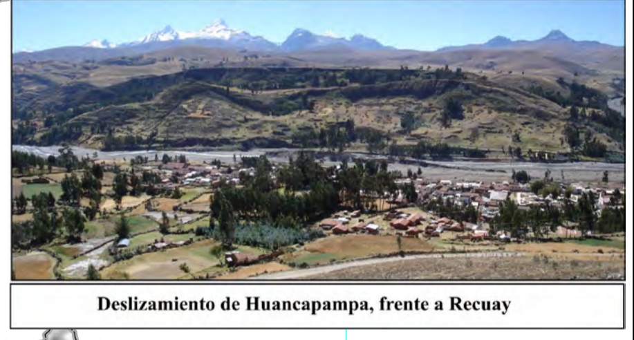
Deslizamiento de Huancapampa, frente a Recay.