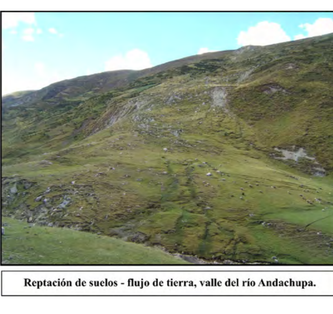
Reptación de lodos - flujo de tierra, valle del río Andashops.