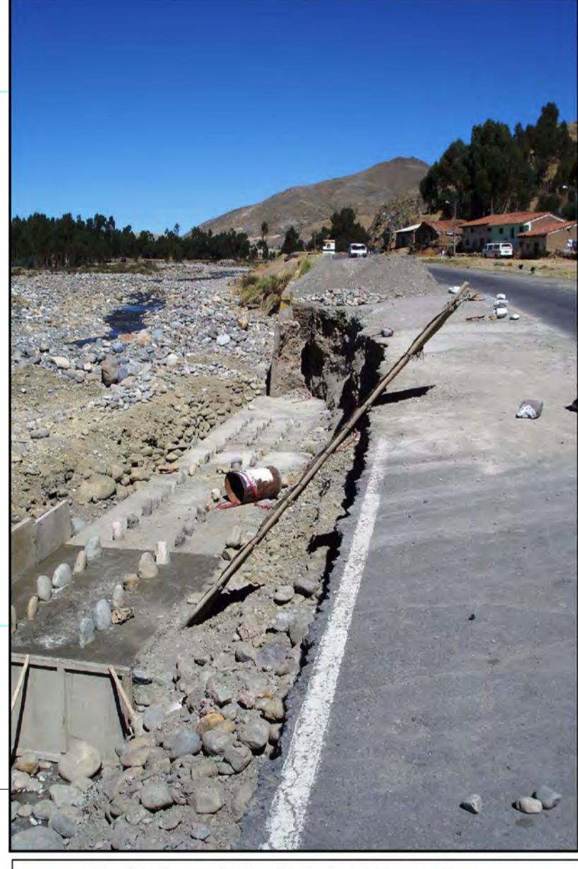
Erosión fluvial del río Santa, entre Catac y Recay.