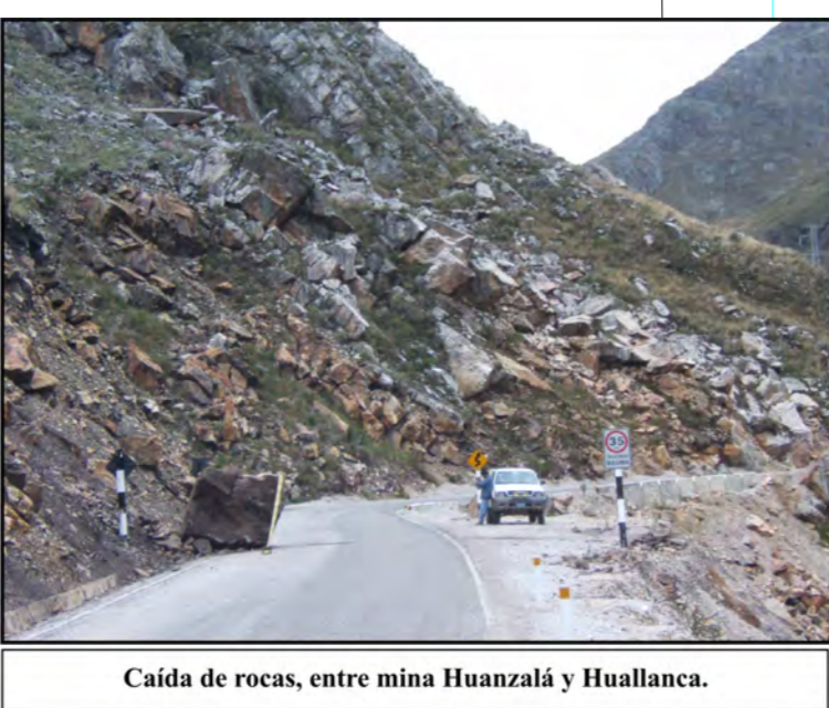
Caída de rocas, entre mina Huanzala y Huallanca.