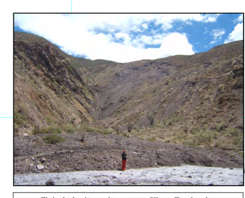
Flujo de detritos en la carretera Sihas-Tayshamba.