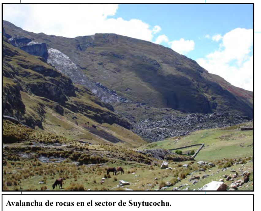
Avalancha de rocas en el sector de Snytaocha.