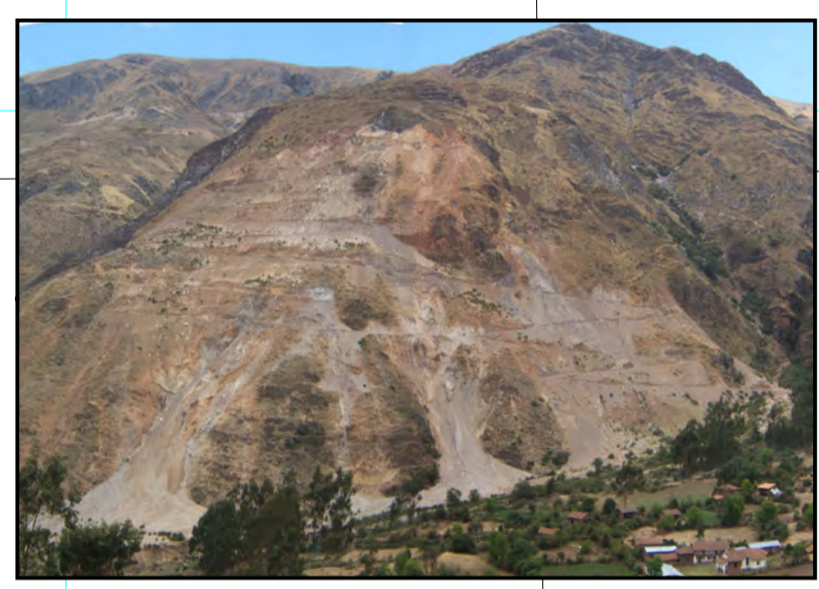
Derrumbes, corte de carretera Pisobamba-Sanaguan.