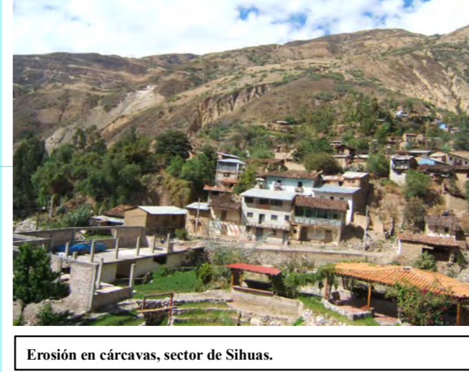
Erosión en cárcavas, sector de Sihas.