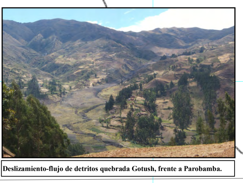
Deslizamiento-flujo de detritos quebrada Cotash, frente a Parshamba.