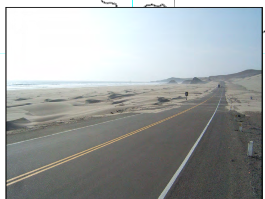
Arenamiento en pampa Gramad, Carretera Panamericana Norte.