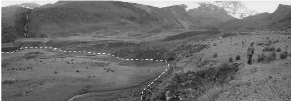
Fig. 3: Zona de trayecto del aluvión de 1945, en líneas entrecortadas se limita la zona donde se depositó parte del flujo de detritos.

El flujo de detritos descendió, por el cauce de la quebrada Alhuaiña con pendiente promedio de 20^\circ arrastrando gran cantidad de material morrénico del cauce y laderas. Con la ampliación del valle y la reducción de la pendiente ( 0^\circ - 2^\circ ) el flujo disminuye la velocidad y deposita albardones con espesores entre 0,5 – 10 m de acuerdo a la morfología del terreno. En esta zona se depositó aproximadamente 150\,000\text{ m}^3 de material (Fig. 3). Al estrecharse el valle y aumentar nuevamente la pendiente ( 6^\circ en promedio) el flujo adquiere más velocidad y erosiona las laderas de fuerte pendiente del valle originando varios movimientos en masa a 8 Km. de distancia (Zavala & Valderrama 2007)