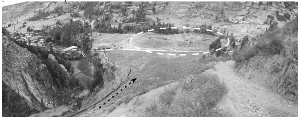
Fig. 4: Abanico aluvial donde se ubica el complejo arqueológico de Chavín de Huantar (en líneas blancas entrecortadas), la flecha entrecortada negra muestra la dirección del flujo de detritos de 1945 y su pequeño poblado (izquierda).

Calicatas excavadas en el pueblo de Chavín revelan espesores del flujo de detritos de hasta 1 metro. Una gran porción del material de flujo quedó en la zona de trayecto gracias a las condiciones topográficas del valle superior.