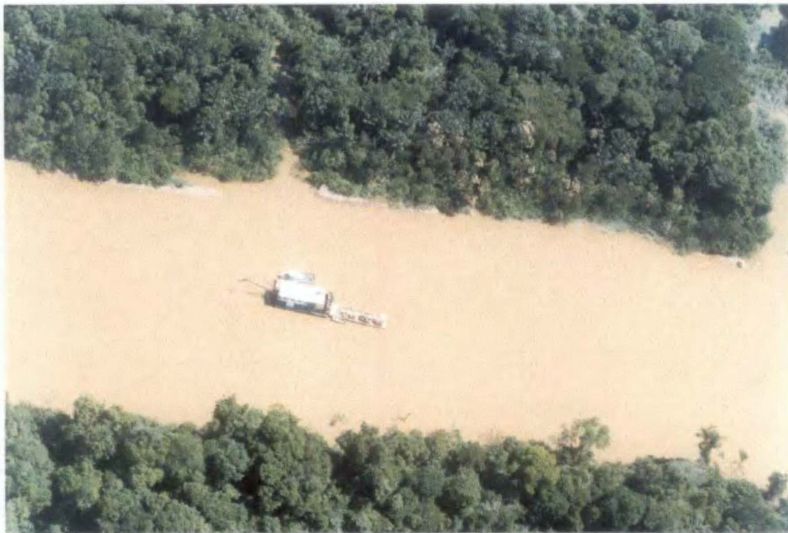
Foto N° 6 Draga N° 5, tomada de las cordenadas 02°43'37", 70°46'50".