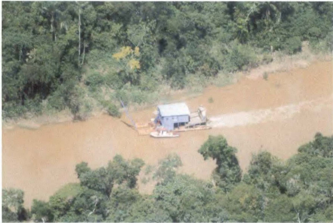
Foto N° 5 Draga N° 4, Tomada desde las cordenadas 02°44'45", 70°50'12"