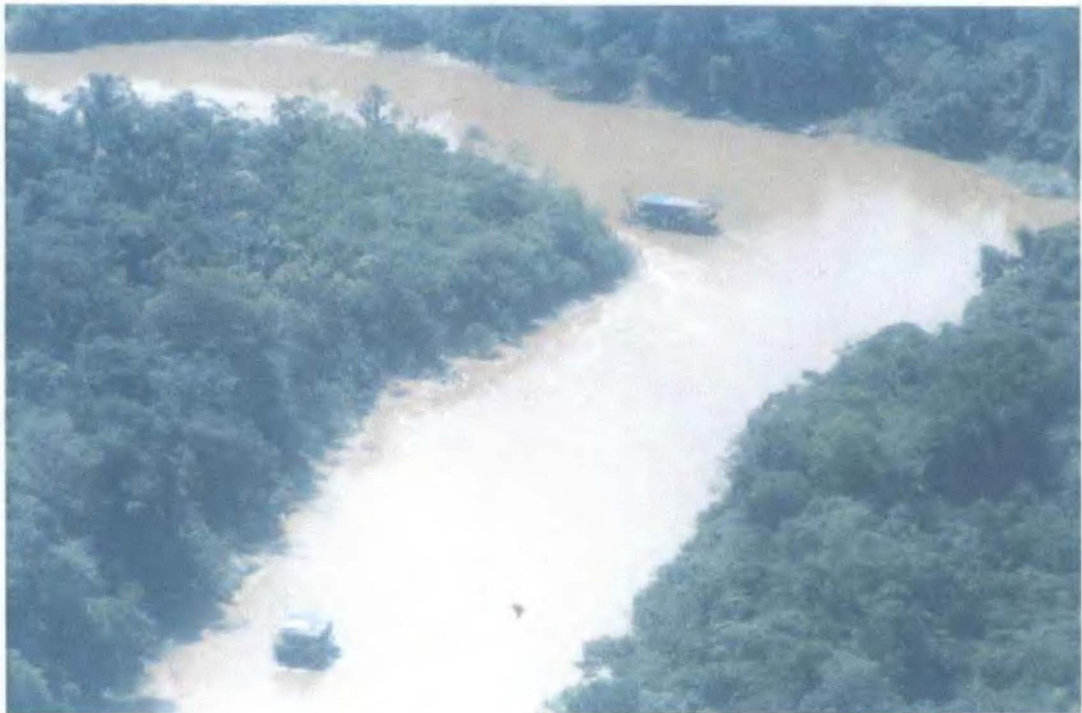
Foto N° 1 Tomada desde las cordenadas 2^{\circ}46'14'' , 70^{\circ}57'4'' , se avistaron las dos primeras dragas.